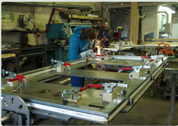
Türenfertigung: Stahlprofile werden in Handarbeit mit Baubronzeblechen belegt