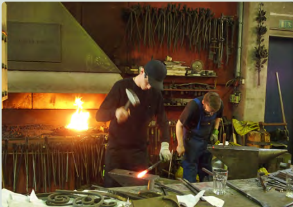
Täglich in Betrieb: der Amboss, an dem Azubis das Schmieden lernen

Die Fittkau Metallbau und Kunstschmiede GmbH blickt auf jahrzehntelange Erfahrung in der Metallgestaltung zurück. Bronzebau und Sonderkonstruktionen sind die Spezialgebiete des Berliner Metallbauunternehmens.