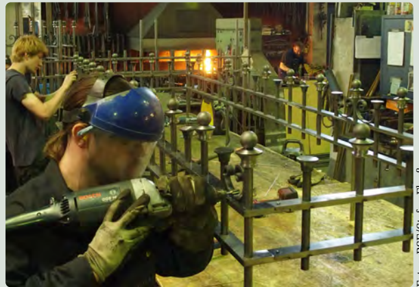
Spezialgebiet: das präzise Fertigen von Zaunelementen aus Baubronze